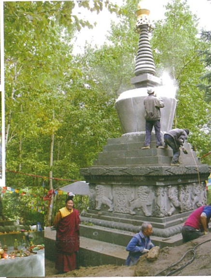
佛塔的裝藏 與 放中脈